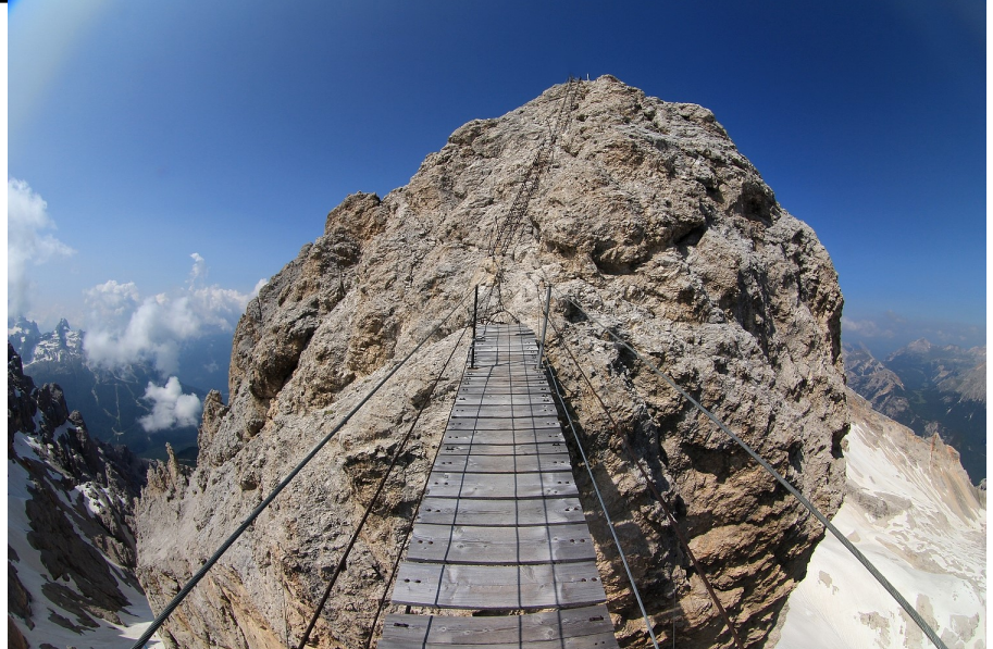
Betriebsübergang - wohin führt der Weg die betroffenen MAVen?

Laut Bürgerlichem Gesetzbuch gilt zunächst der Grundsatz,